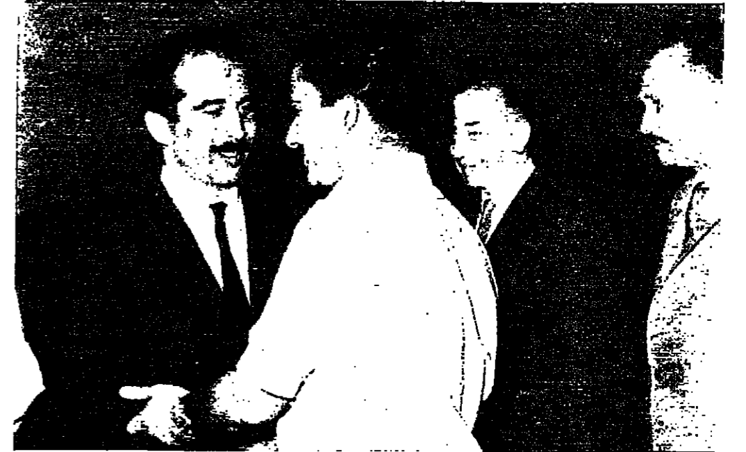
سوا البحر حسن يستقبل سوا الأبراهيم لدى وصوله الى مطار عسقلان في الصورة دولة السيد بجيت التلفزيوني رئيس الوزراء والسيد عاكف الفايض وزير المواصلات